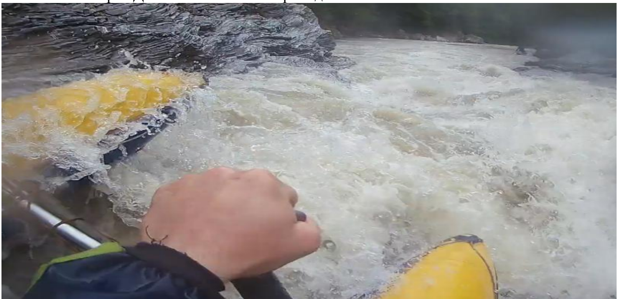
Фото 62. порог Руфабго 5Вкс проходит К1.