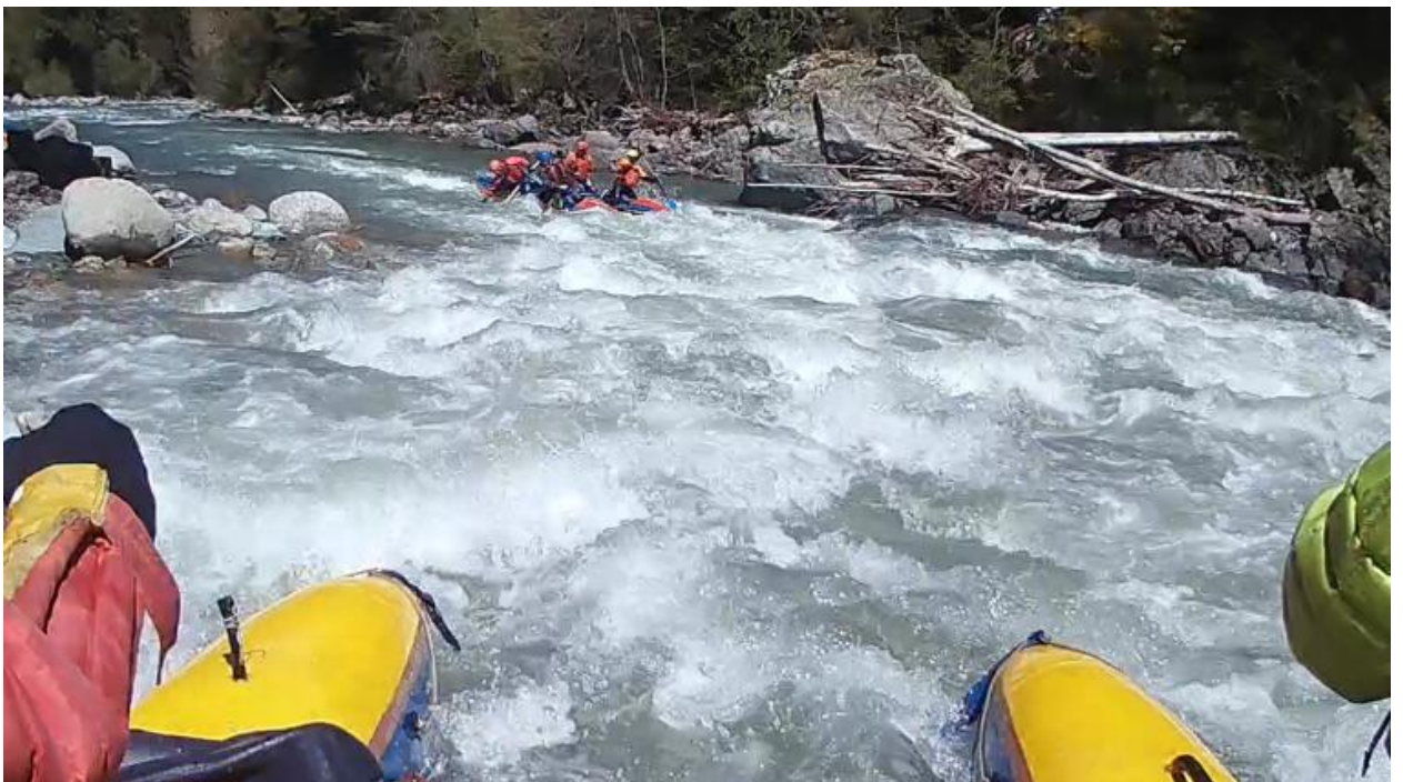
Фото 24. р Б. Зеленчук прохождение взрывных порогов.