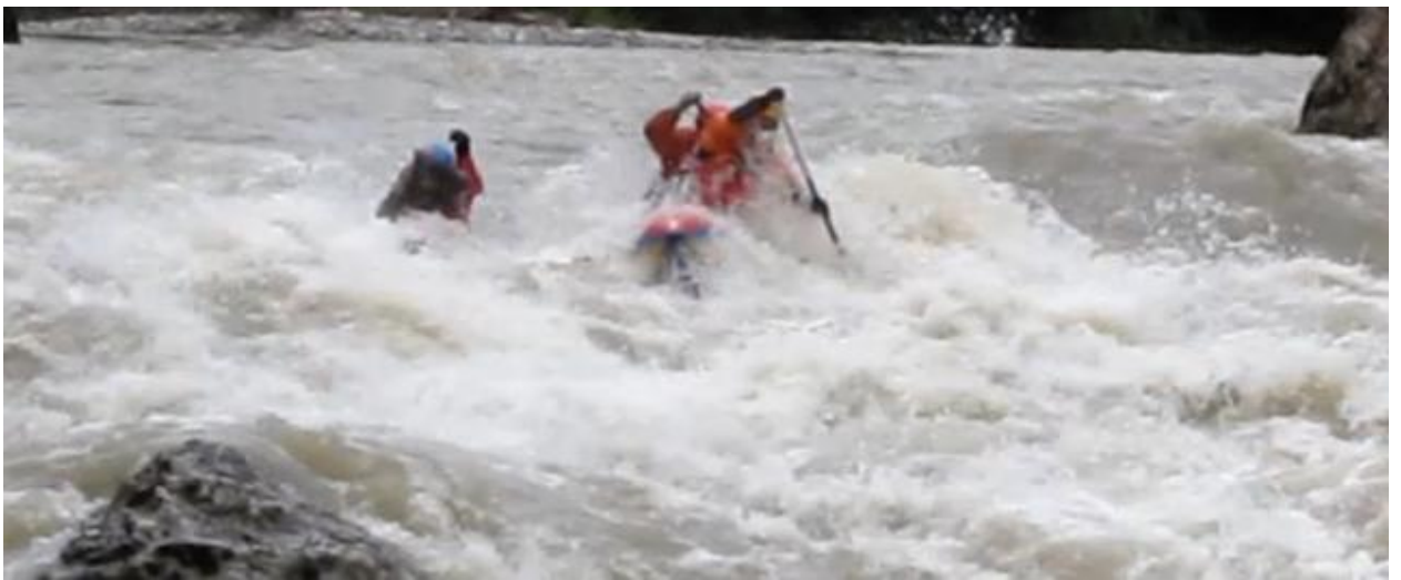
Фото 61. порог Девичьи слезы 5Акс проходит К4-2.