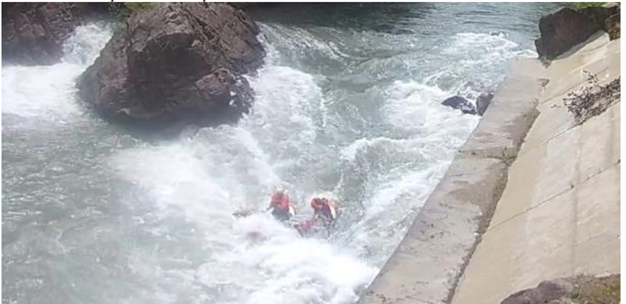
Фото 49. Порог Киши-1 проходит К4-3.