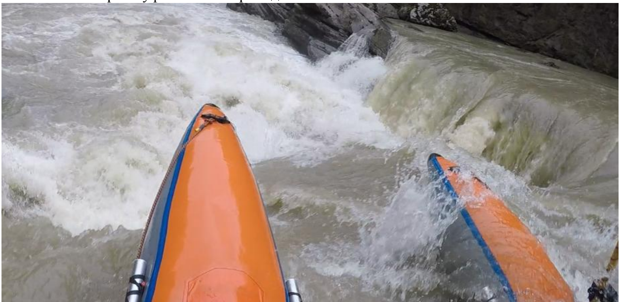
Фото 65. порог Мишоко 5Акс проходит К5.