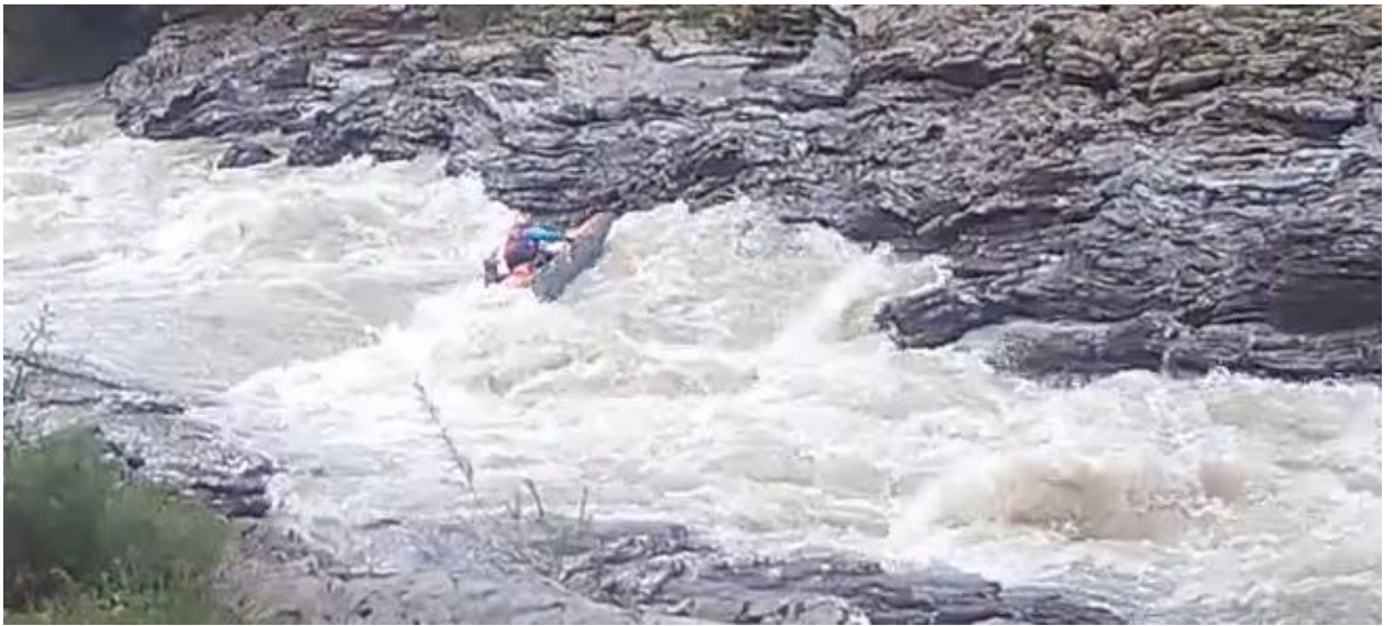
Фото 63. порог Руфабго 5Вкс проходит К5.