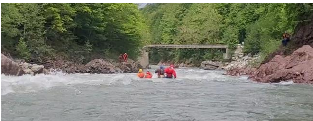
Фото 56. Порог Киши-2 проходит К4-2.

Зачалившись на ЛБ, хотели разведать реку Киша с последующем прохождением, но проход через мост закрыт! Забор с колючей проволокой и злые дяденьки с собаками. В общем с Кишой не получилось, поэтому прошли до поляны у Хамышек к обеду. На этом сплав окончен.