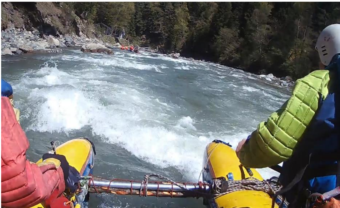
Фото 25. р Б. Зеленчук прохождение взрывных порогов.

5.05.23. Подъем в 7.00. В 9:40 выехали к пор. ПР (прощай Родина).