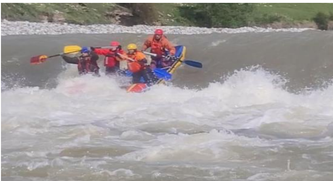
Фото 16. р Кубань пор Горка 4Акс проходит К4-2