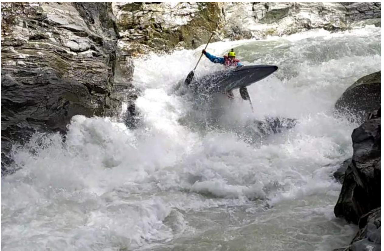
Фото 34. Пронеси Господи 5Скс проходит К5 киль в бочке основного слива