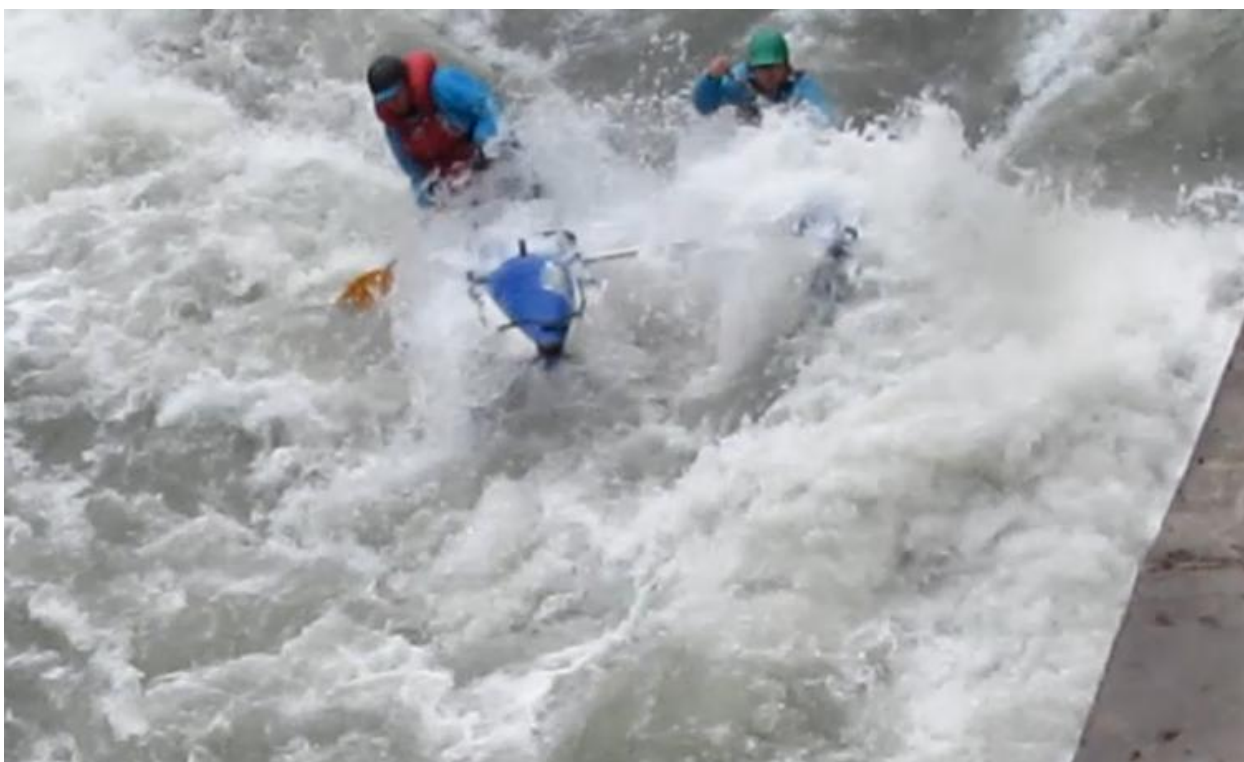
Фото 47. Порог Киши-1 проходит К4.

Провели разведку: Киши-1 5В кс. большой 2-х метровый слив с промывной бочкой и шишкой 1,5м, далее прижим к бетонной стене и на выходе в воде кусок бетона с торчащей арматурой.