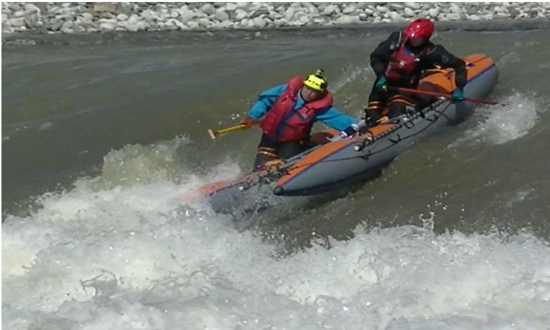
Фото 14. р Кубань пор Горка 4Акс проходит К5