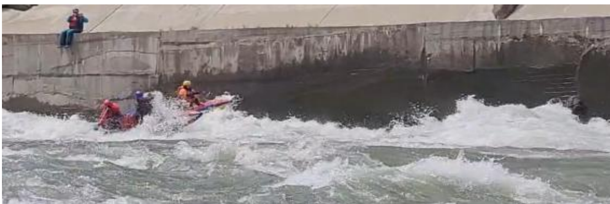
Фото 55. Порог Киши-1 проходит К4-2.