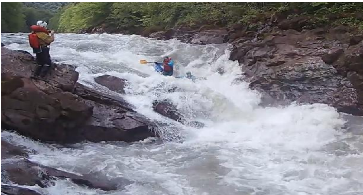
Фото 42. Порог Топоры 5С кс проходит К4

Затем К2, вошли чисто в слив видимо при погружении задели носом дно и их перевернуло по диагонали через нос. Трое остались в периметре, а четвертый пошел самосплавом, но его быстро выловили спасконцом. Затем тем же способом выловили и сам кат с людьми. Параллельно их страховали К1 и К4 с воды.