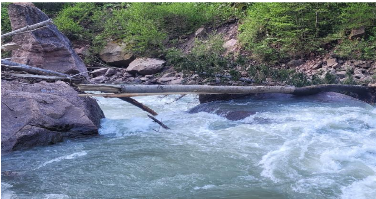
Фото 40. Пор Кирпич, бревна однако.

Далее дошли до пор. Кирпич, в нем завал с двух сторон, решили закончить сплав на этом участке и попробовать пробиться на Малую Лабу. Нам конечно официально отказали в посещении заповедника, но местные сказали, что на месте можно договориться.