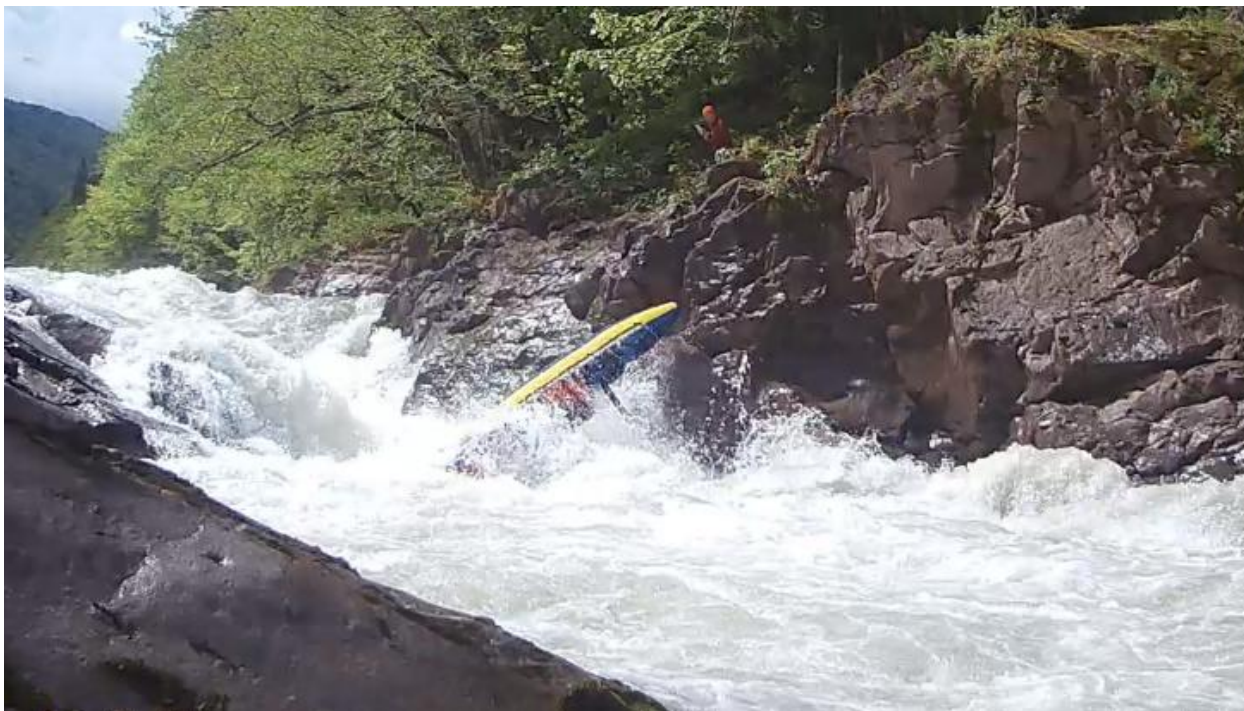
Фото 46. Порог Топоры 5С кс проходит К4-2 наброс на скалу ЛБ и киль.

Затем за 5 минут дошли 500м до пор. Киши. Зачаились на ЛБ за 100м до порога.