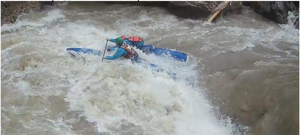
Фото 58. порог Девичьи слезы 5Акс проходит К4.