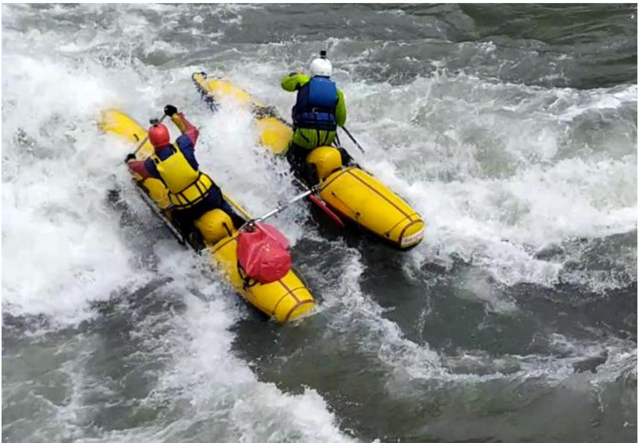
Фото 51. Порог Киши-1 проходит К1.