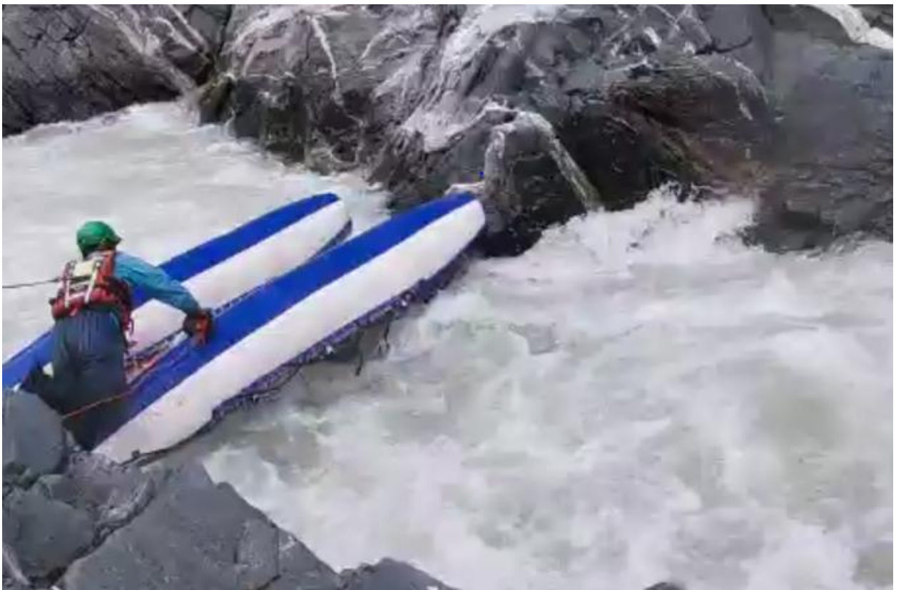
Фото 36. Пронеси Господи 5Скс проходит К4 без экипажа. Живец вытаскивает пустой кат.