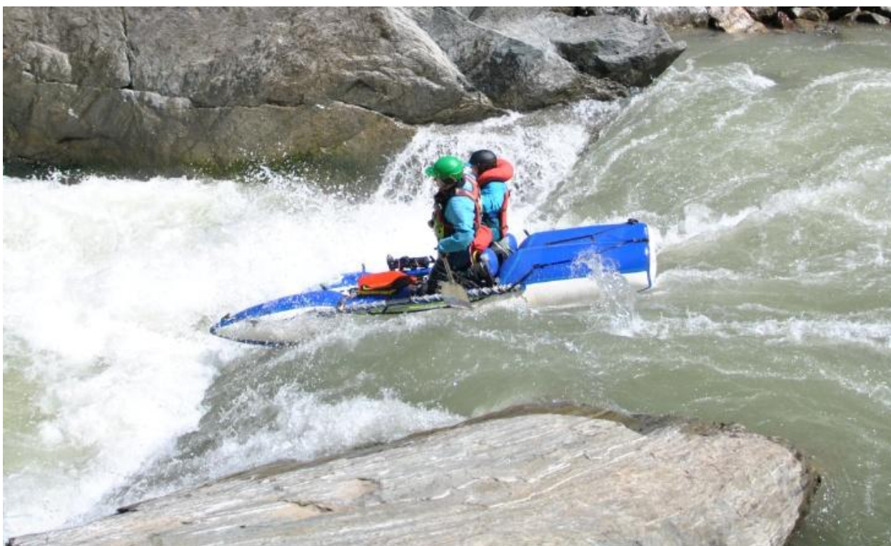
Фото 28. Порог Прощай Родина 5Вке проходит К4.