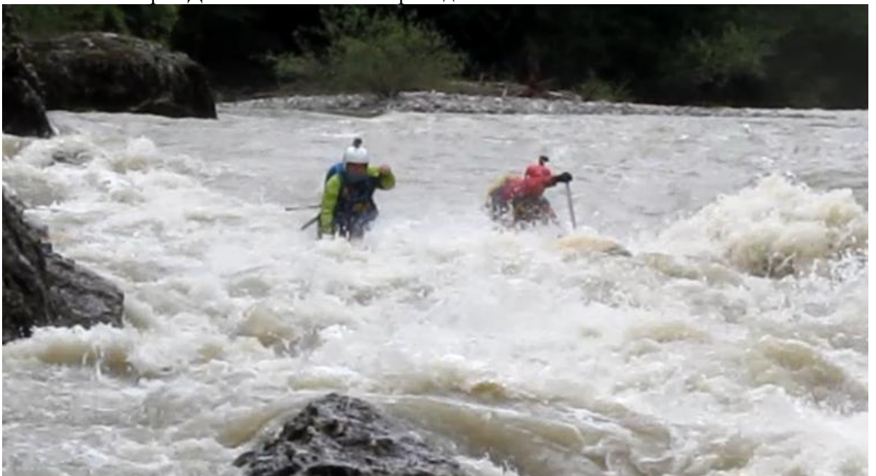
Фото 59. порог Девичьи слезы 5Акс проходит К1.