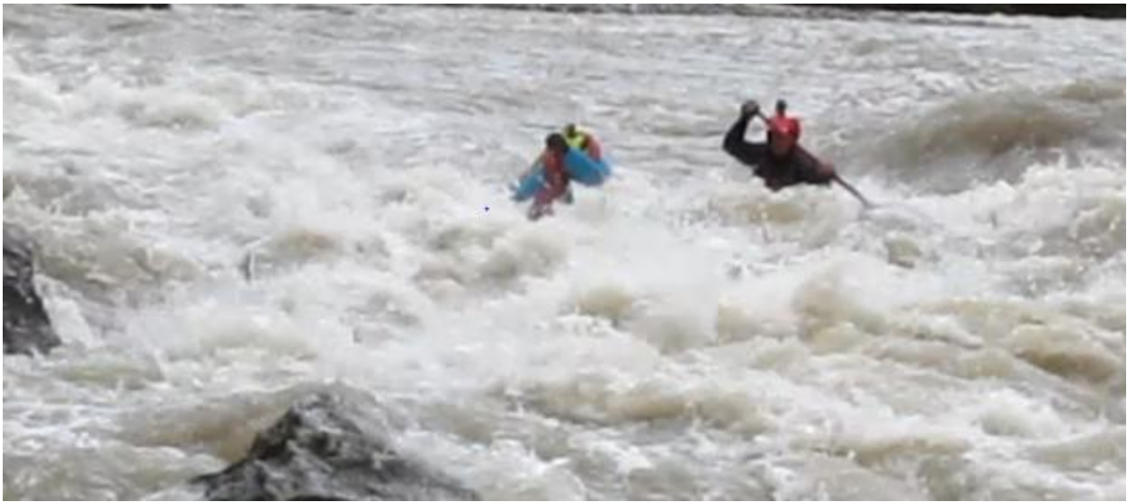
Фото 60. порог Девичьи слезы 5Акс проходит К5.