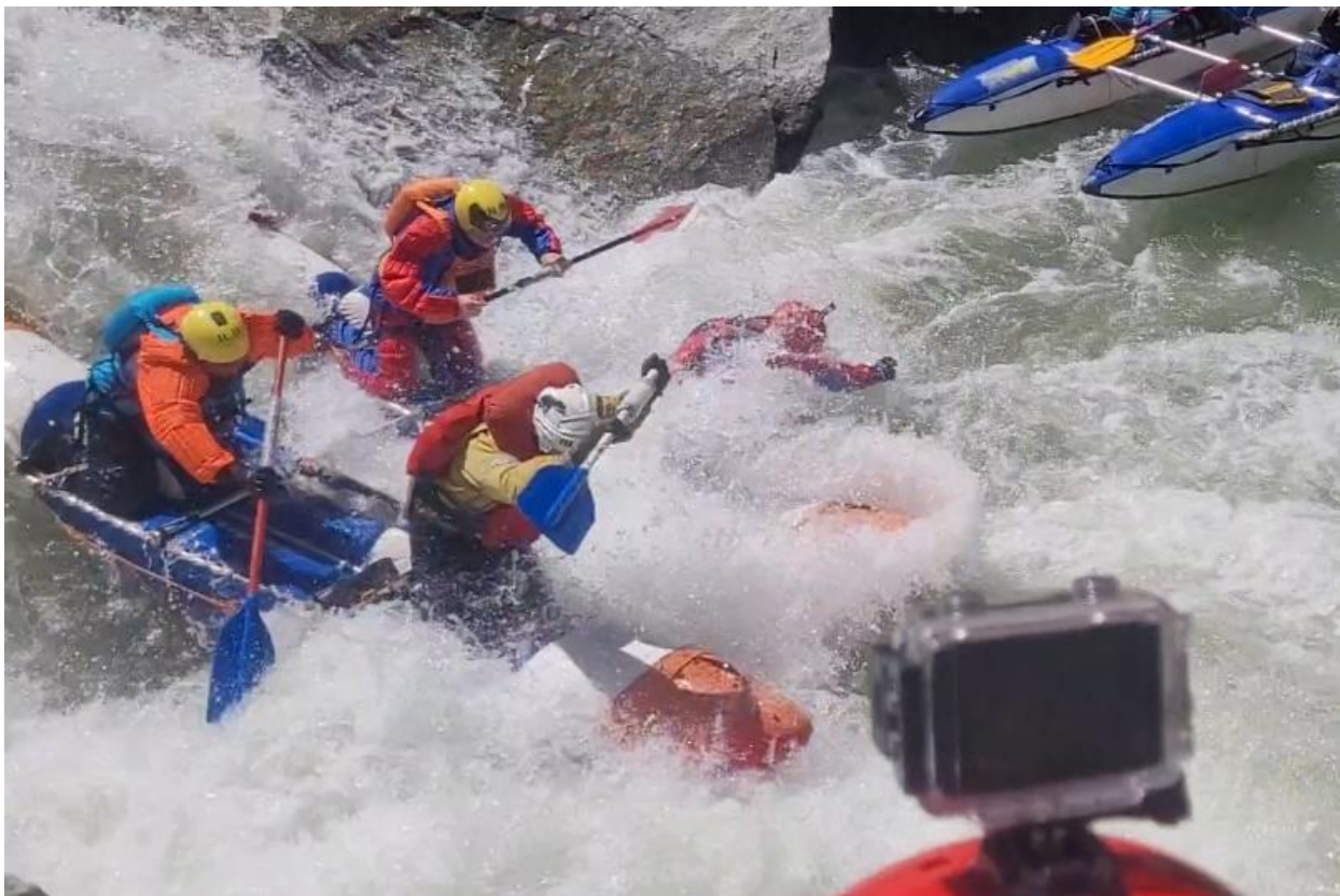
Фото 29. Порог Прощай Родина 5Вкс проходит К4-3.