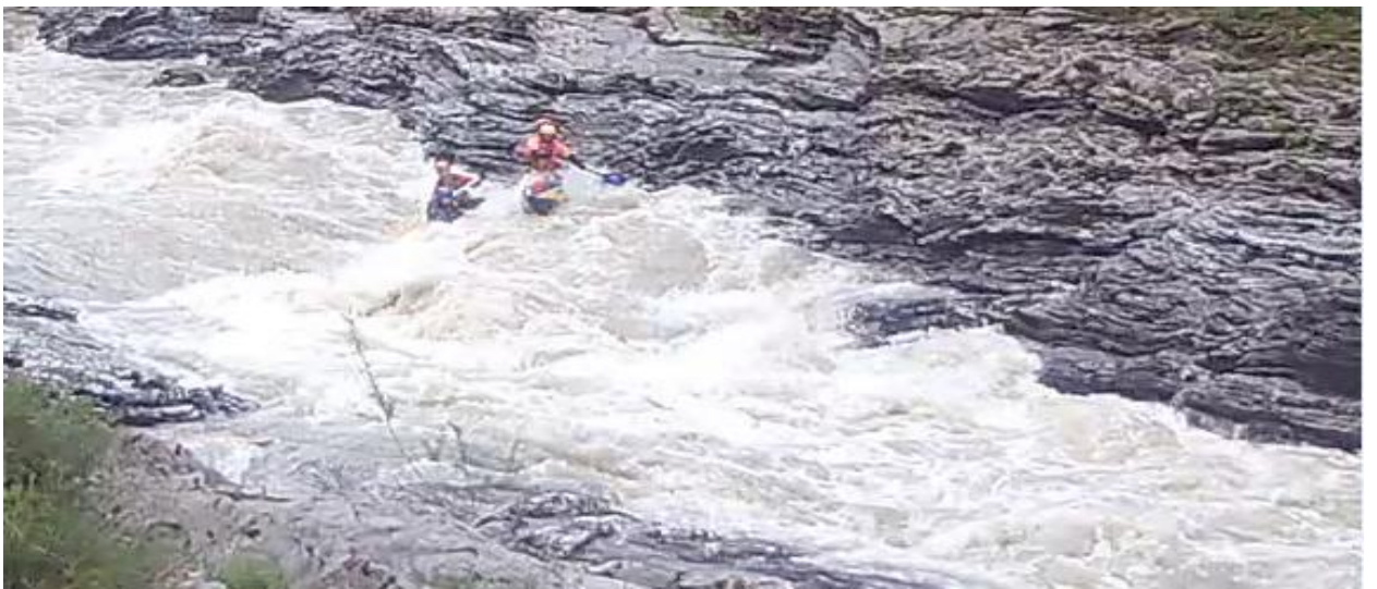
Фото 64. порог Руфабго 5Вкс проходит К4-2.