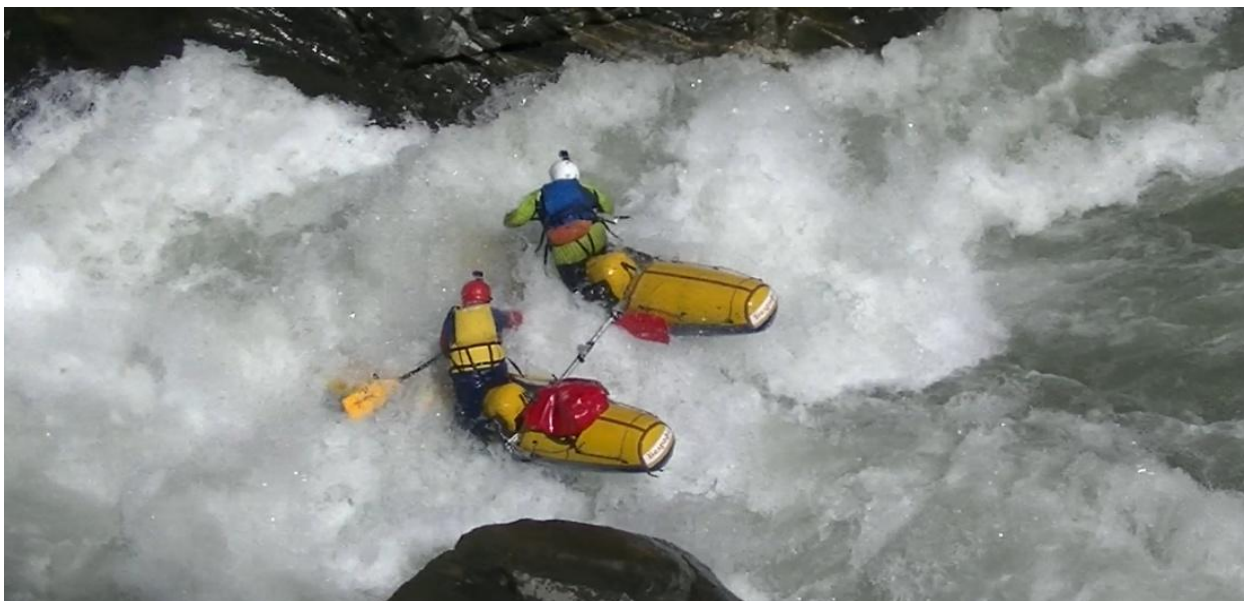
Фото 31. Пронеси Господи 5Скс проходит К1 вход в основной слив, жуть.

К4 прошел порог самосплавом без экипажа с переворотом в прижиме и выловлен живцом в конце порога. К4-2 первую часть делали проводку, а вторую обносили по ЛБ. Сразу за порогом зачалились в одном месте, и в 16:30 поехали в лагерь к мосту.