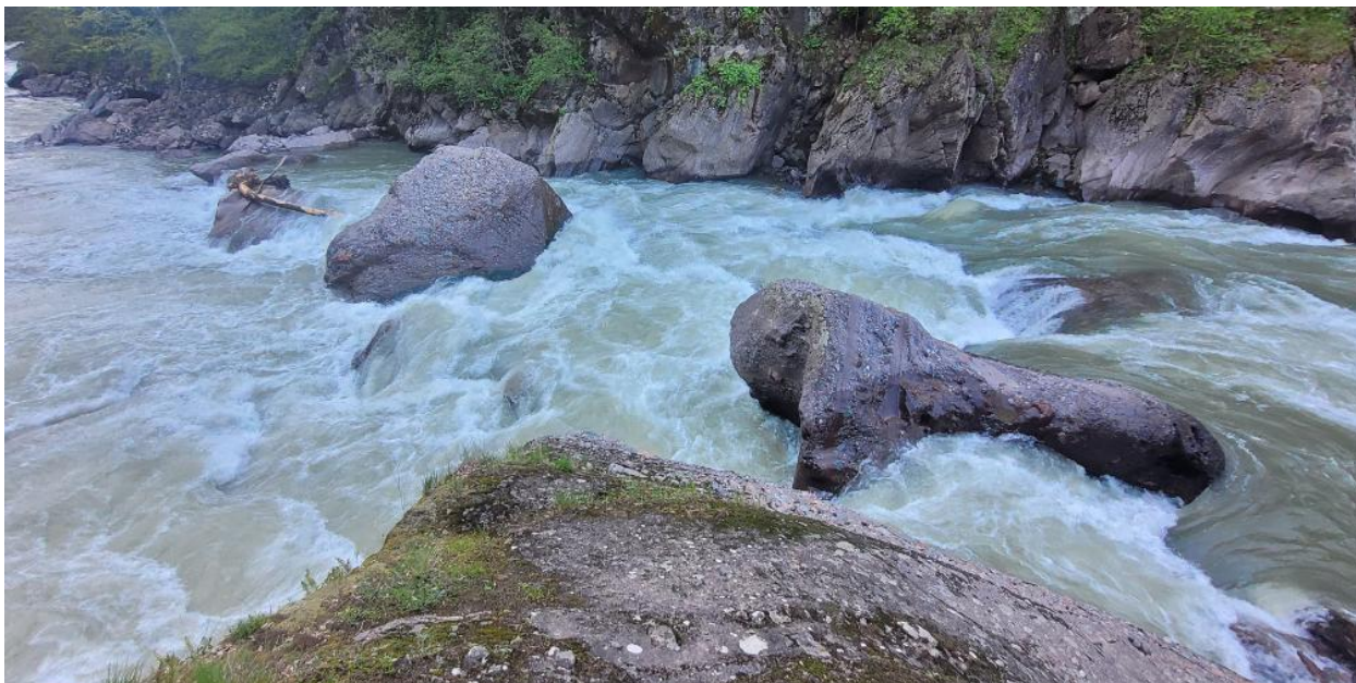
Фото 41. Порог Затычка, обнос.

Приехали к Кордону Черноречье, нам долго никто не открывал, потом мы нашли сторожа, и он нам дал понять, что река на долгие годы закрыта для туристов водников! Говорит, что 4 года назад в пороге погиб человек и теперь они ни под каким предлогом не пускают туда водников.