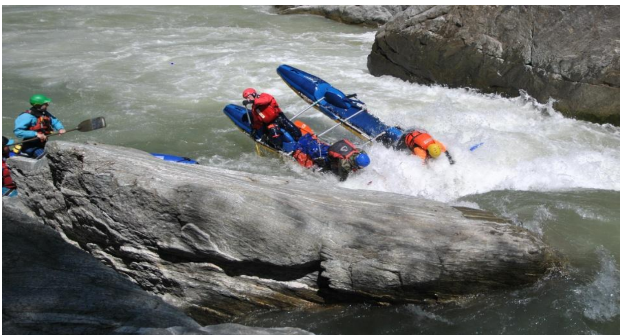
Фото 30. Порог Прощай Родина 5Вкс проходит К4-2. Борисыч решил самоходом.

Далее небольшой прогон 300 м и начинается пор. ПП (пронеси Господи) 5С кс. с чалкой на ЛБ для осмотра.