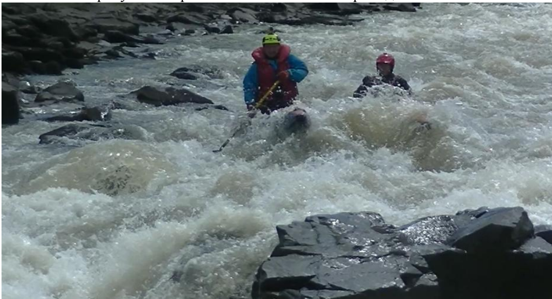
Фото 11. р Кубань пор Каменомосткий 4Вкс проходит К5.