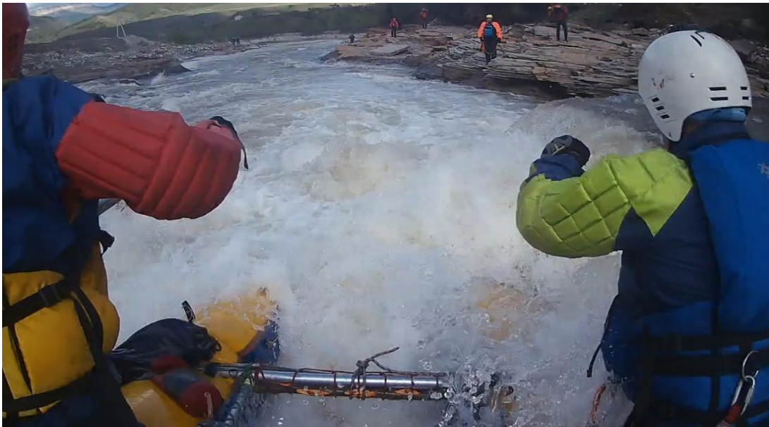
Фото 19. р Кубань пор Джонни 4Акс проходит К1