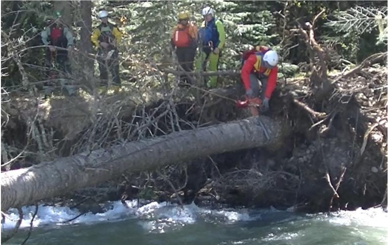
Фото 23. р Б. Зеленчук начало сплава. Убираем завал