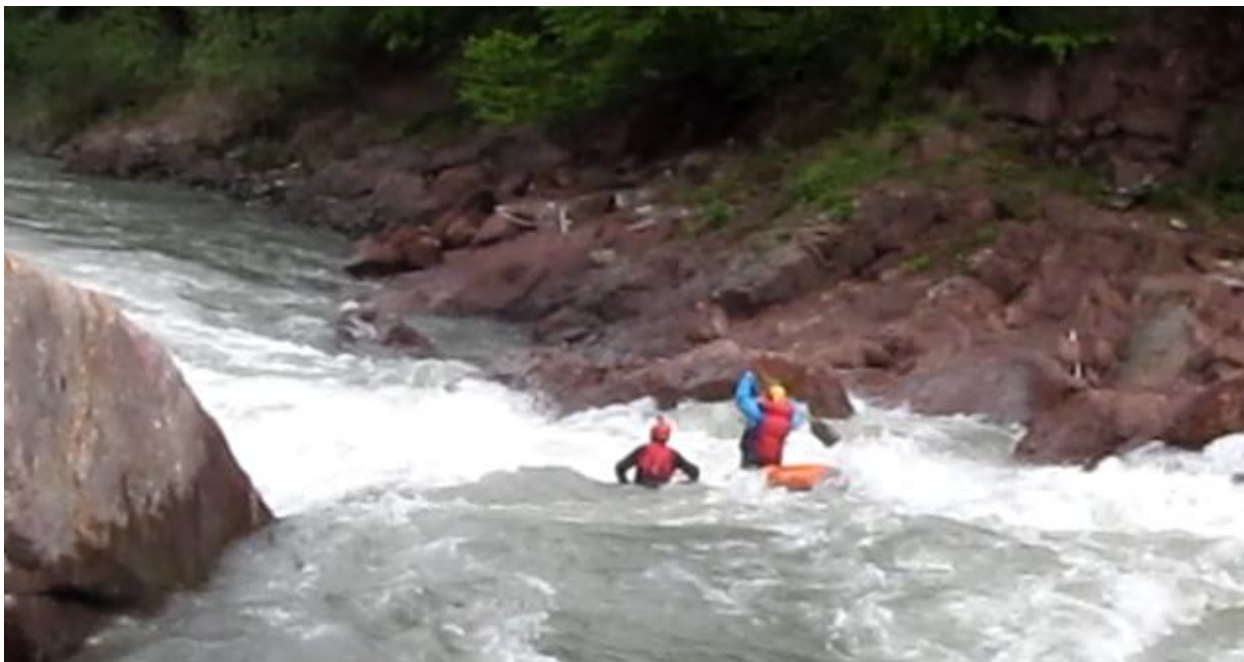
Фото 54. Порог Киши-2 проходит К5.