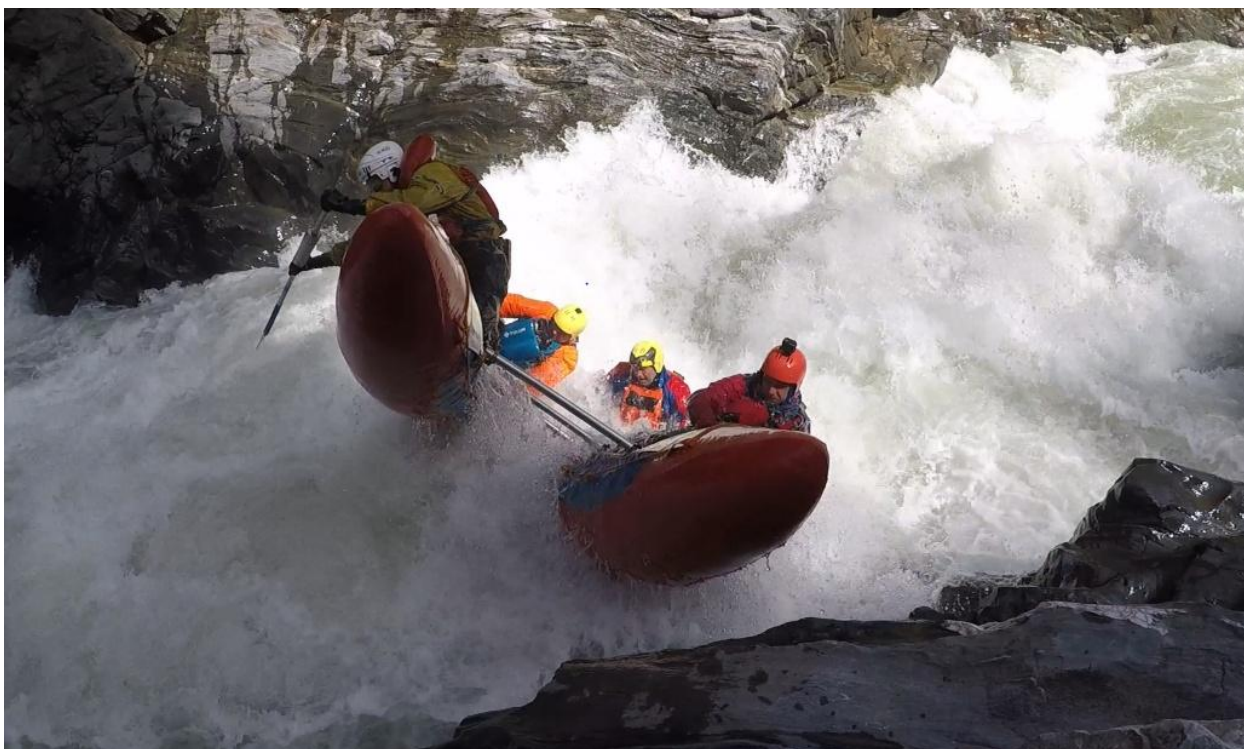
Фото 32. Пронеси Господи 5Скс проходит К4-3 свеча в бочке основного слива.