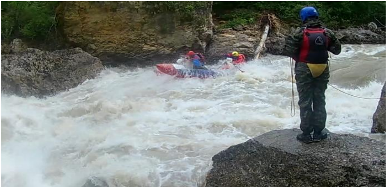
Фото 57. порог Девичьи слезы 5Акс проходит К4-3.