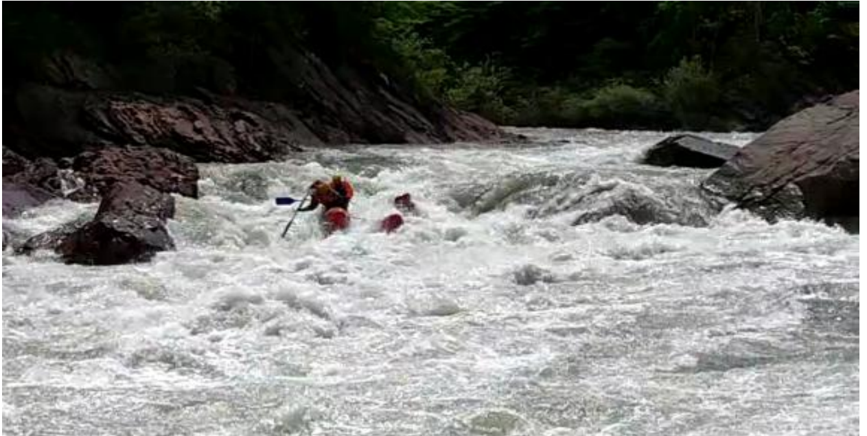
Фото 50. Порог Киши-1 проходит К4-3.