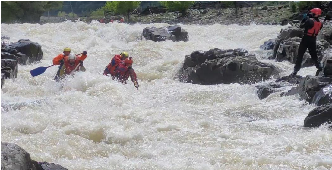
Фото 9. р Кубань пор Каменомосткий 4Вкс проходит К4-3