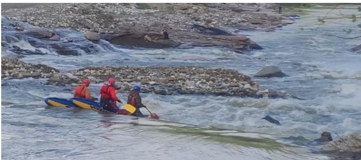
Фото 18. р Кубань пор Джонни 4Акс проходит К4-2