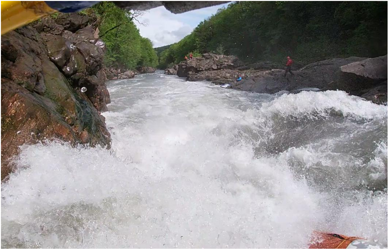
Фото 44. Порог Топоры 5С кс проходит К4-3 чисто.