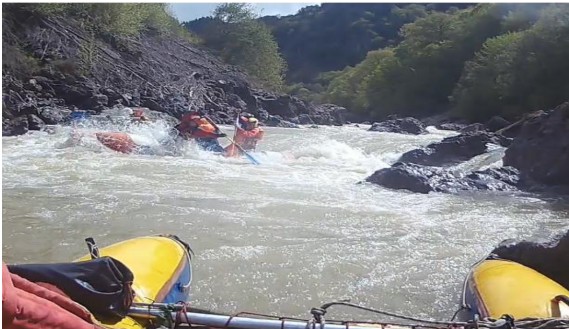
Фото 5. р Кубань пор Аманхит 4Акс проходит К4-3.

В 6:00 подъём дежурных, завтрак, разведка порога Аманхит, сборы и в 10:10 мы вышли на воду.