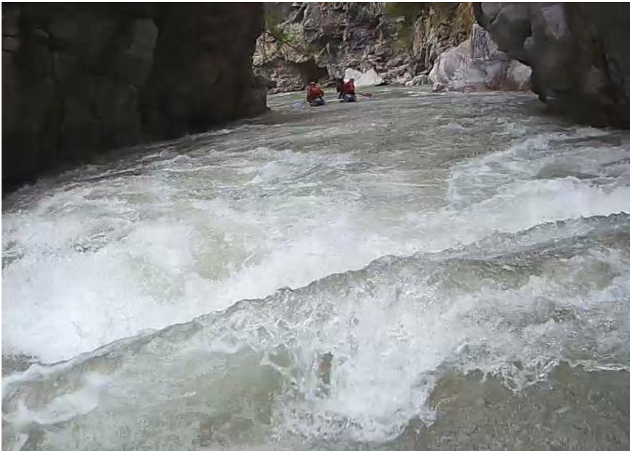
Фото 39 пор Б. Блып 4Акс проходим слева по струе, кильватерной колонной.

Далее дошли до пор. Кирпич, в нем завал с двух сторон, решили закончить сплав на этом участке и попробовать пробиться на Малую Лабу. Нам конечно официально отказали в посещении заповедника, но местные сказали, что на месте можно договориться.