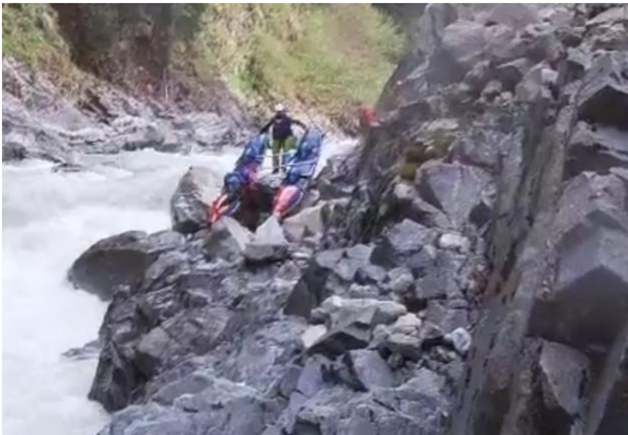
Фото 37. Пронеси Господи 5Скс проходит К4-2 по левому берегу, обнос.

На сегодня сплав окончен. Погода ясная +20.