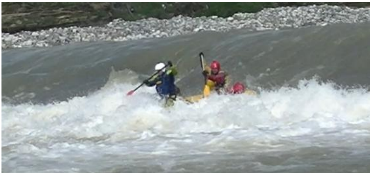
Фото 12 р Кубань пор Горка 4Акс проходит К1

Описание порога: через всю реку идет бетонная плотина для забора воды в ГЭС и через нее переливается вода по всей ширине, слив длиной 18-10м с бочкой по всей ширине реки. Его проходили в том же порядке что и предыдущий порог по одному экипажу.