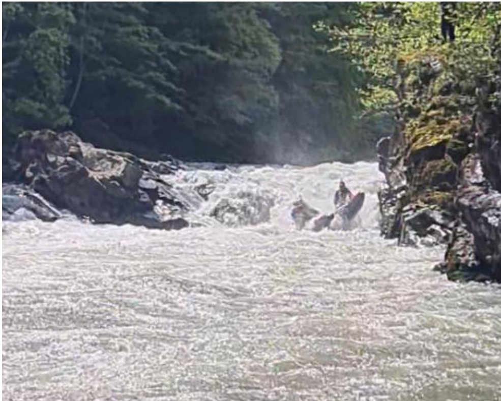
Фото 45. Порог Топоры 5С кс проходит К5 чисто.