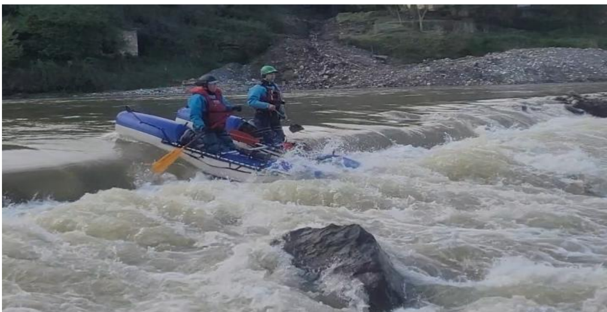
Фото 17. р Кубань пор Джонни 4Акс проходит К4

Часть группы пошла на страховку и съёмку, а К2 и К4 ждали указаний. Сообщив по рации линию движения начали прохождение порога в следующем порядке: К4, К2, К1, К5, К3. Пройдя еще 2км по реке в 16:20 зачалились на ЛБ перед автомобильным мостом.