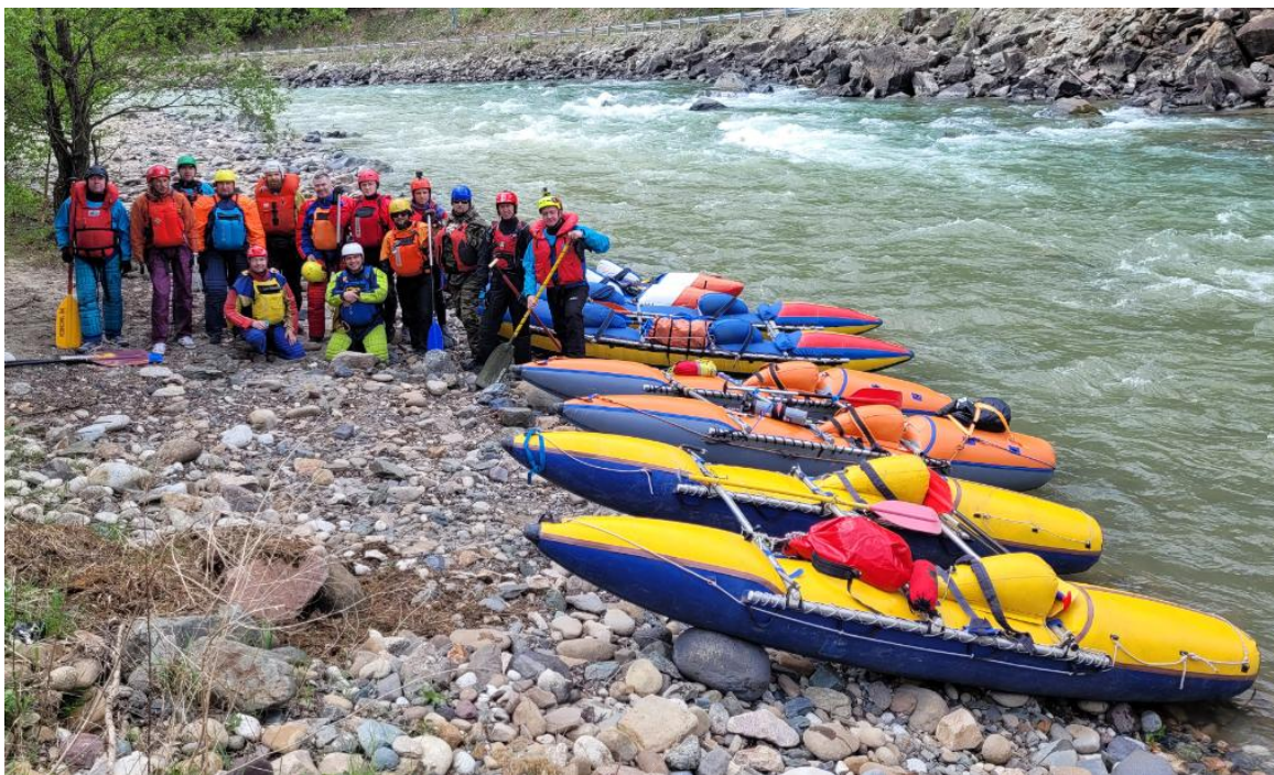
Фото 4. Старт на р. Кубань.

По пути был один короткий порог 100м 3-4 кс прошли ходом подстраховывая с воды.