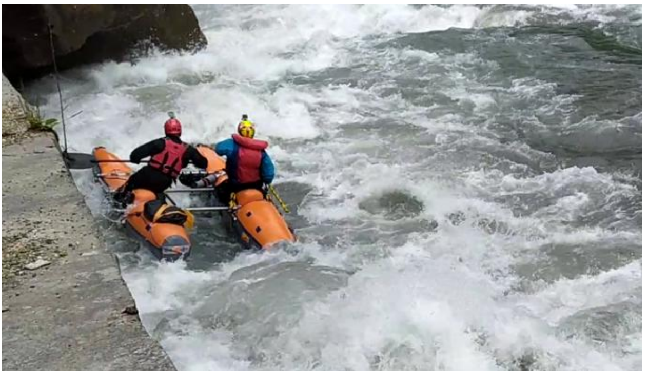
Фото 53. Порог Киши-1 проходит К5.