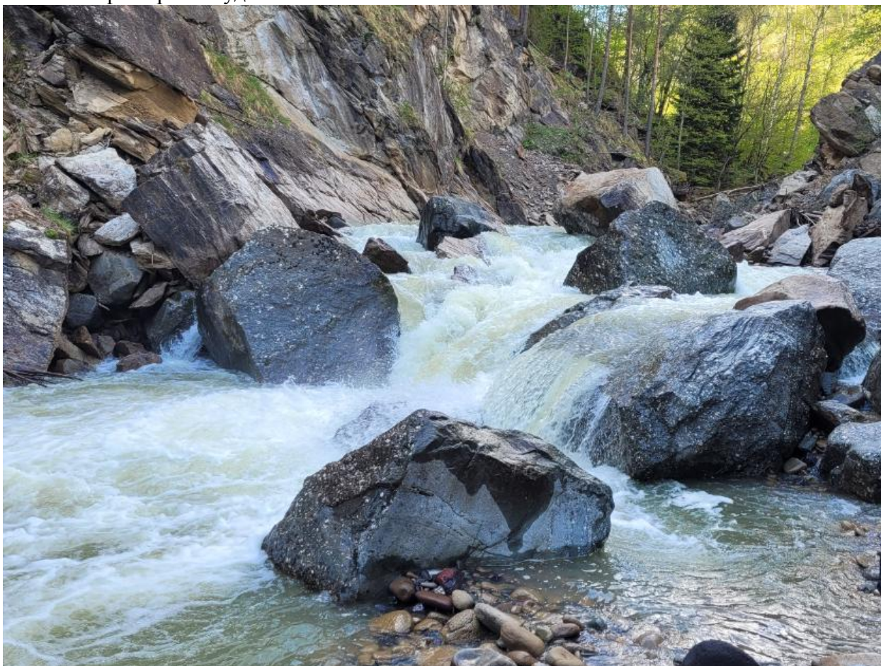
Фото 2. Пороги реки Худес.