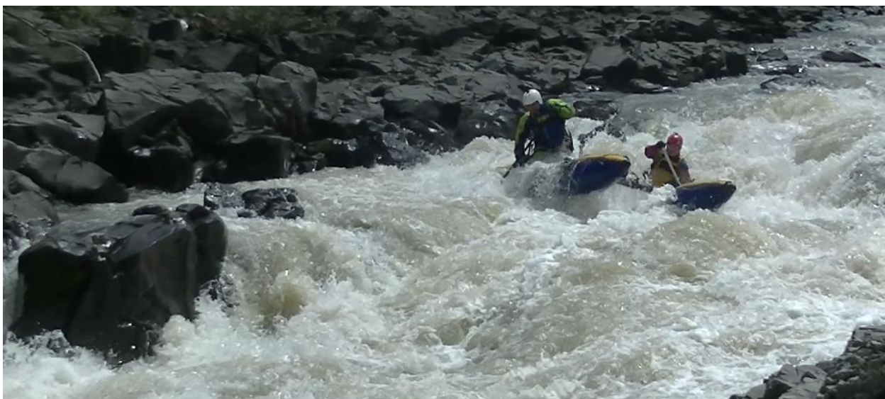
Фото 7. р Кубань пор Каменномостский 4Вкс проходит К1

При прохождении главное удержат кат от набросов на камни.