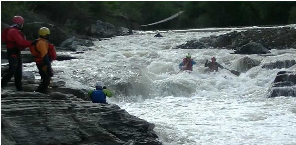
Фото 20. р Кубань пор Джонни 4Акс проходит К5