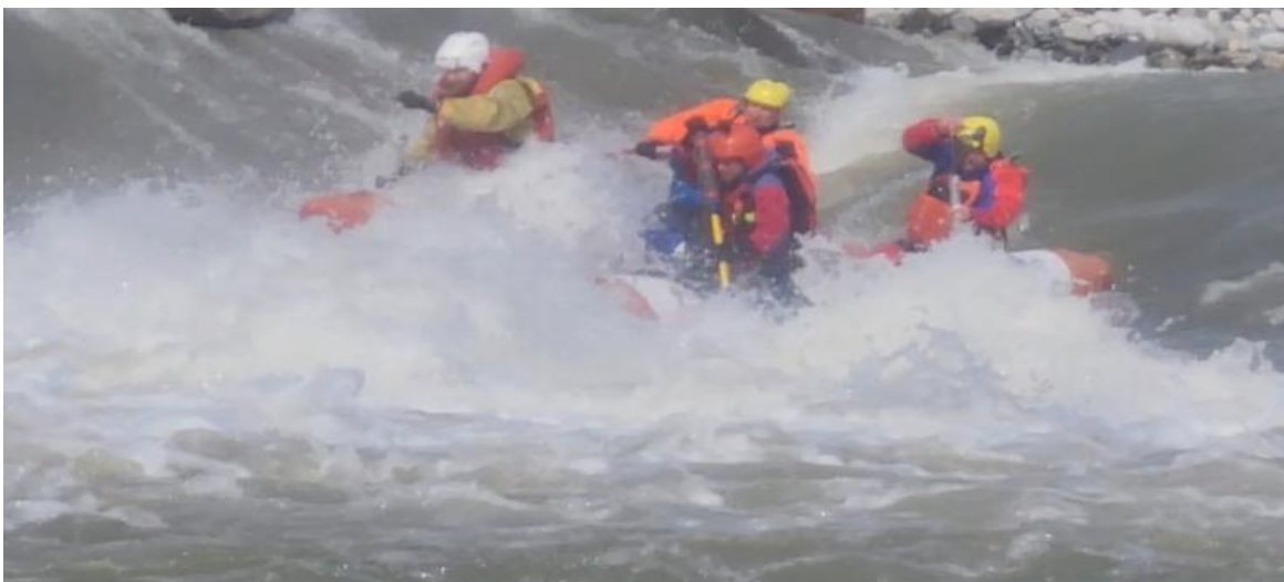
Фото 15. р Кубань пор Горка 4Акс проходит К4-3