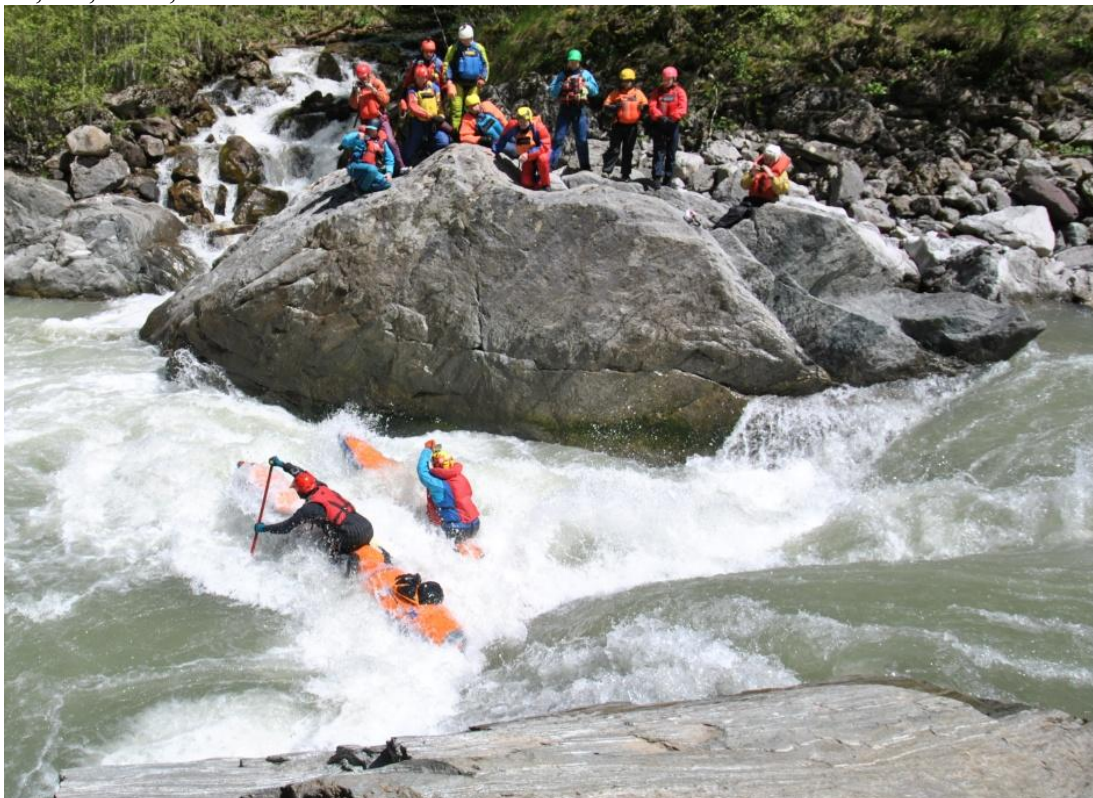
Фото 26. Порог Прощай Родина 5Вкс проходит К5.

Расставив страховку, фото, видео, начали прохождение порога в следующем порядке: К5, К1, К4, К4-3, К4-2.