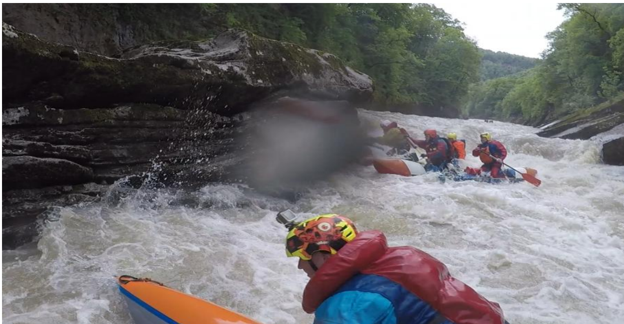
Фото 66. порог Мишоко 5Акс проходит К4-3.