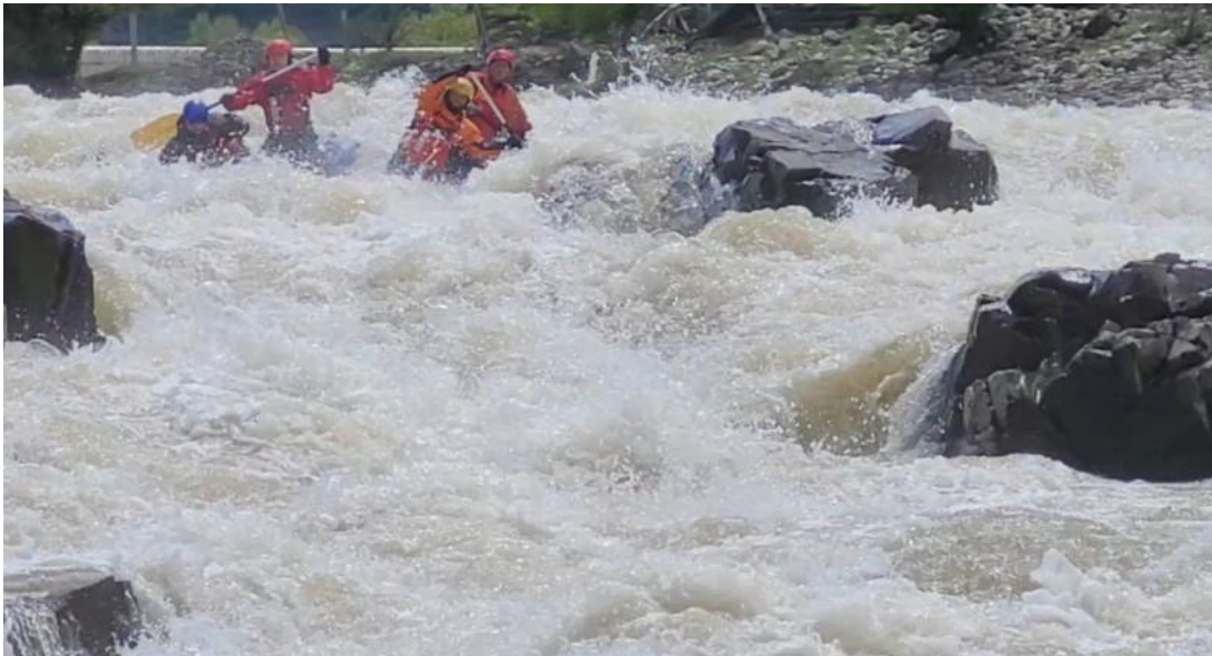
Фото 10. р Кубань пор Каменомосткий 4Вкс проходит К4-2.