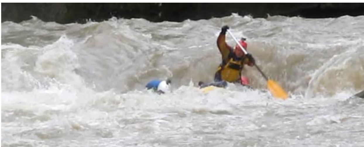
Фото 67. порог Мишоко 5Акс проходит К1.