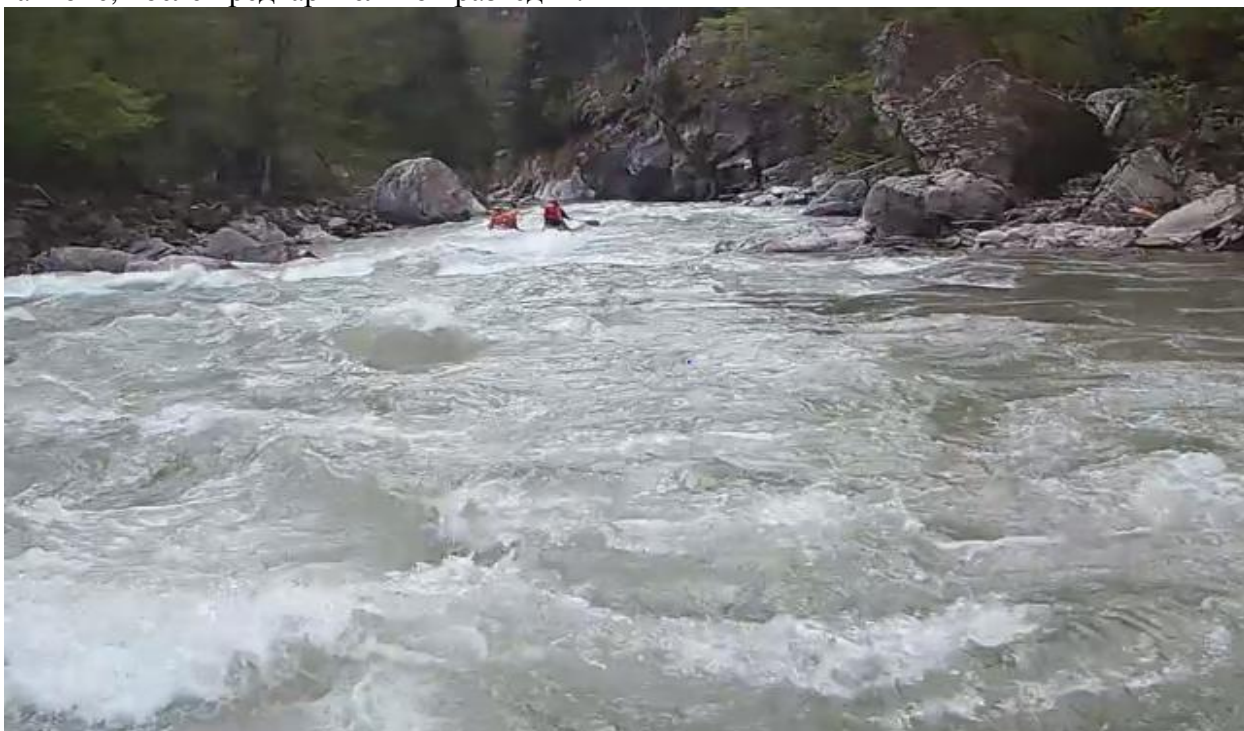
Фото 38 Подход к пор Б. Блып.

Прошли Б Блыб 4А кс. предваряет участок шивер 500м, одинокий слив с бочкой в каньоне, после предварительной разведки.