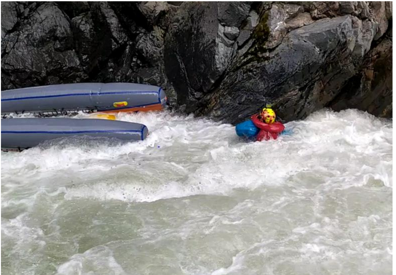
Фото 35. Пронеси Господи 5Скс проходит К5 после кия.