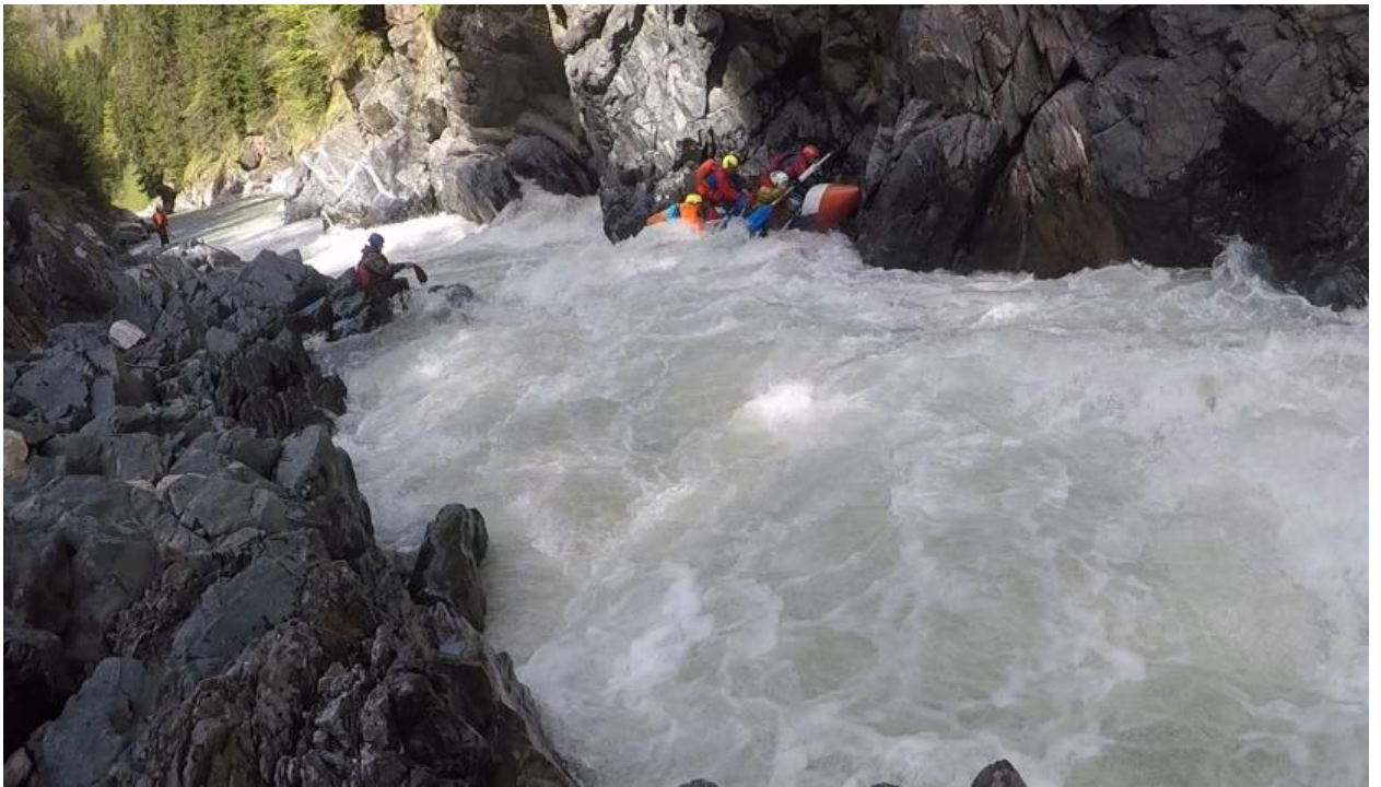
Фото 33. Пронеси Господи 5Скс проходит К4-3 навалило, сейчас лягут