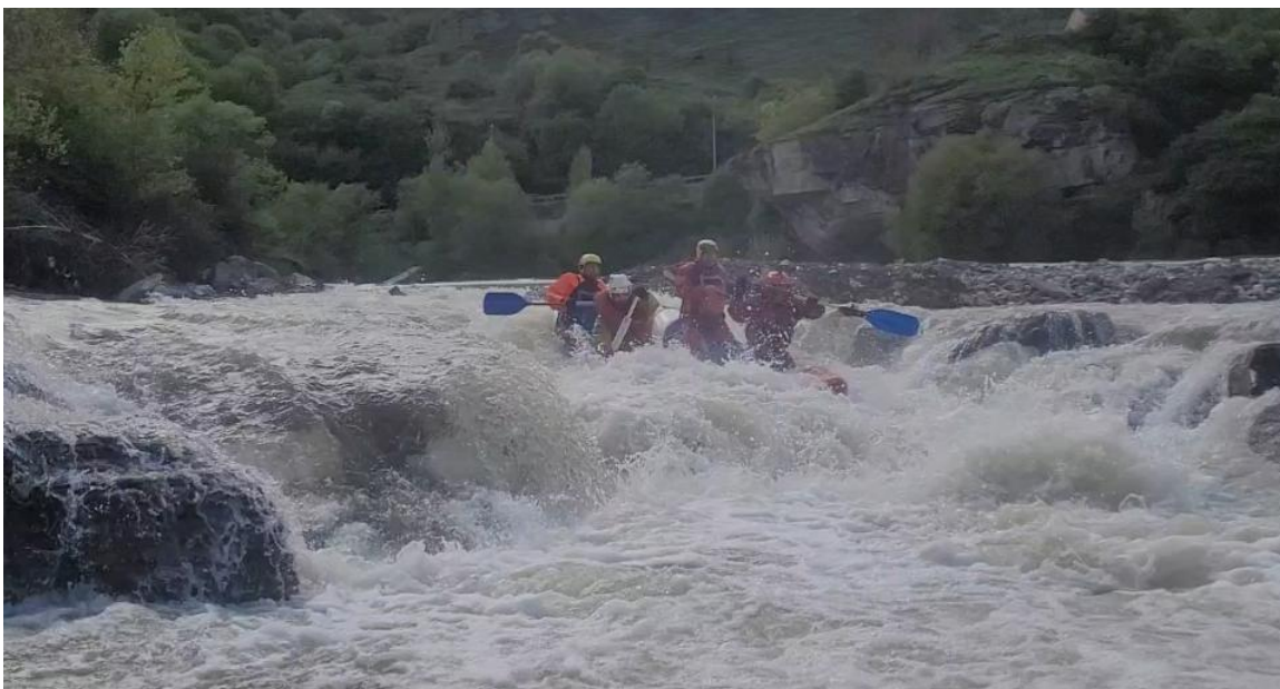
Фото 21. р Кубань пор Джонни 4Акс проходит К4-3