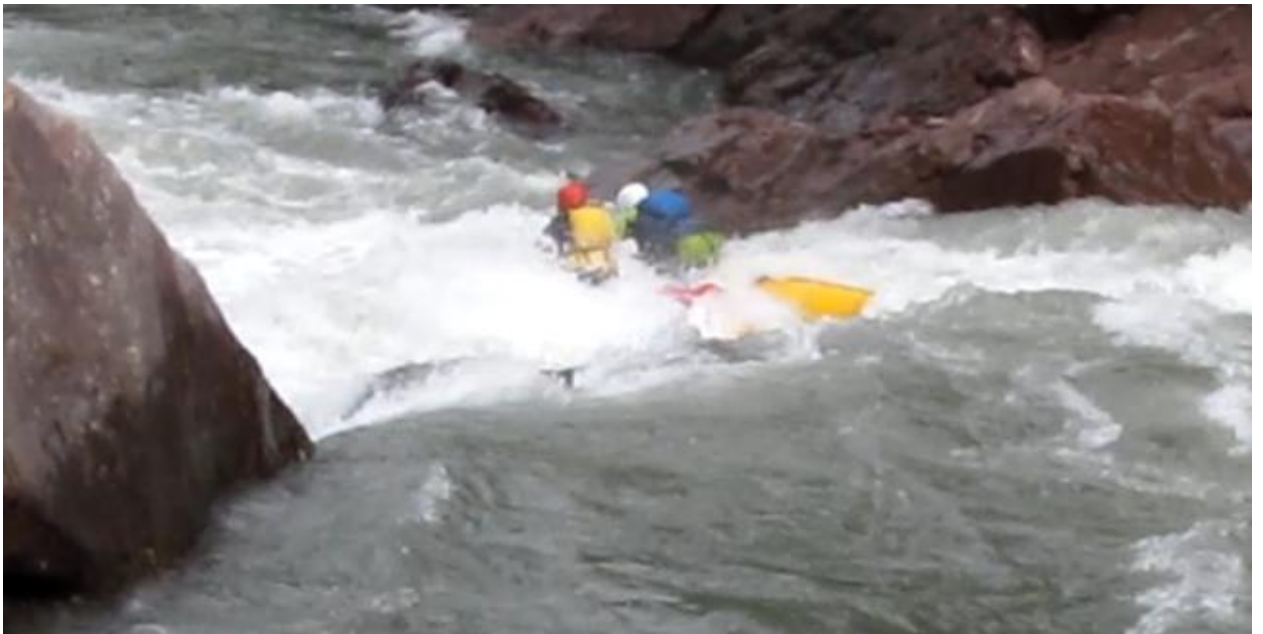
Фото 52. Порог Киши-2 проходит К1.