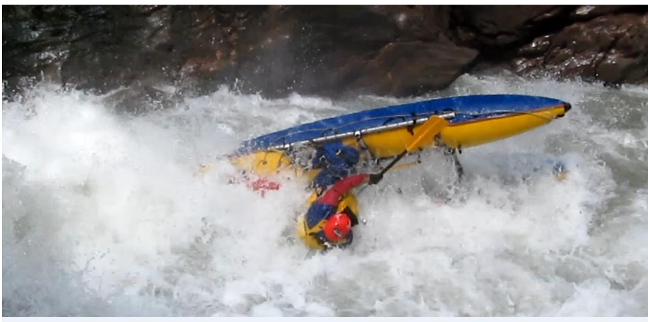
Фото 43. Порог Топоры 5С кс проходит К4 наброс на скалу ЛБ и киль.