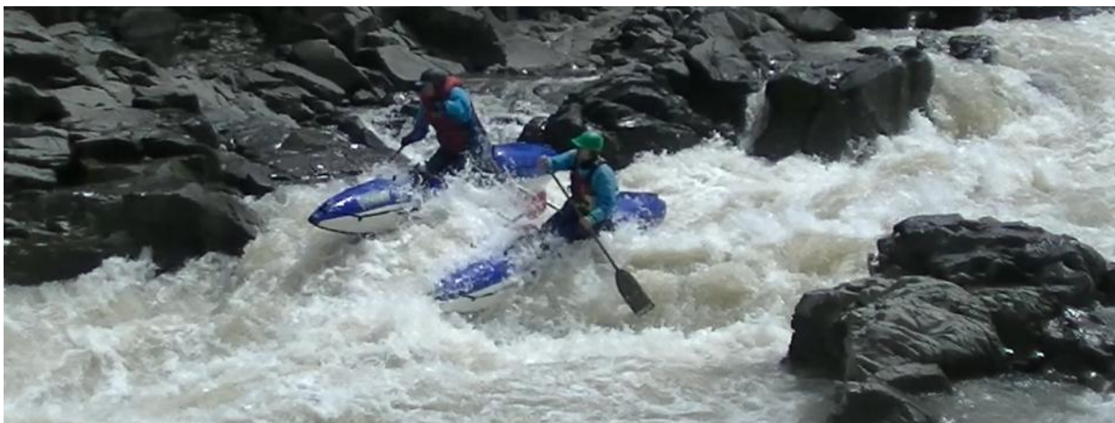
Фото 8. р Кубань пор Каменномостский 4Вкс проходит К4