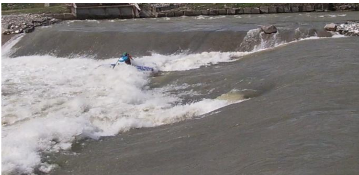
Фото 13. р Кубань пор Горка 4Акс проходит К4