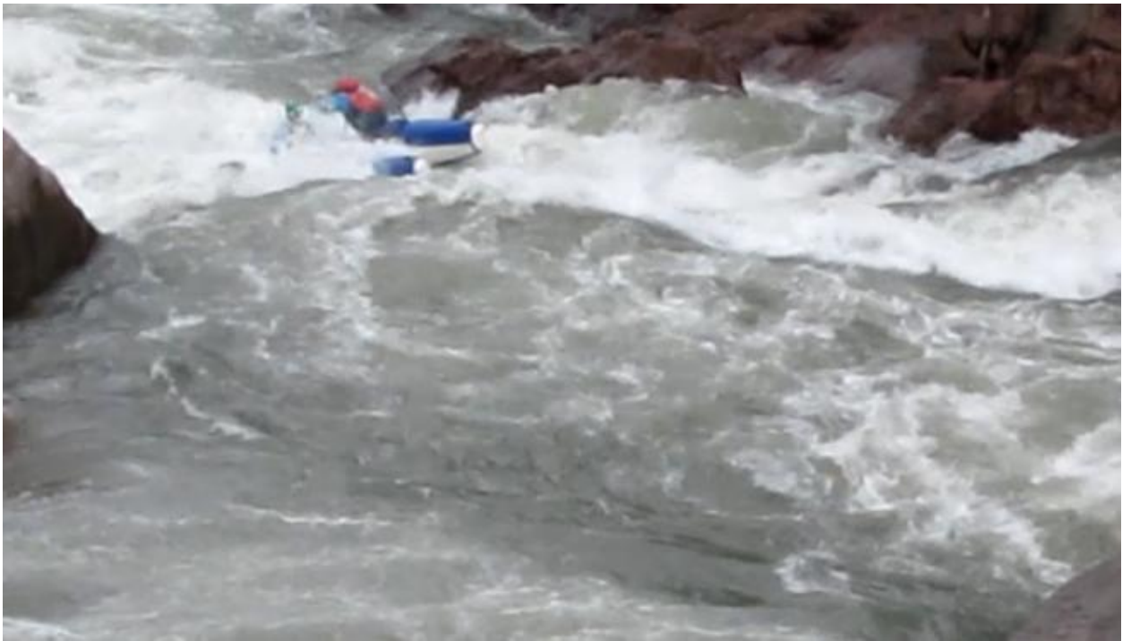
Фото 48. Порог Киши-2 проходит К4.